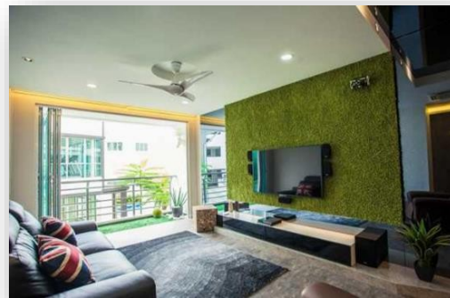
Варианты использования искусственной травы в интерьере

Основание должно быть ровным, сухим и чистым.